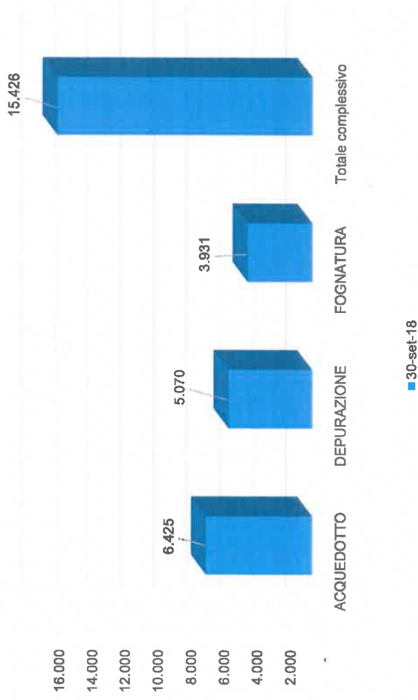
Investimenti 30 settembre 2018